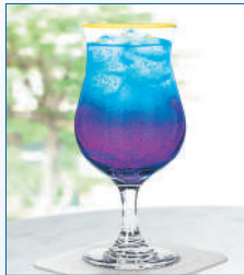
ノンアルコールカクテル「紫紅釉盆」