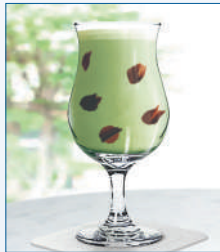
ノンアルコールカクテル「飛青磁花生」