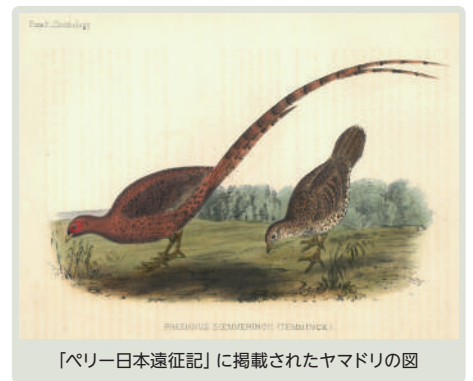
「ペリー日本遠征記」に掲載されたヤマドリ(の図)

ホームページ https://www.omnh.jp/ アクセス ●Osaka Metro御堂筋線「長居」3号出口・東へ約800m ●JR阪和線「長居」東出口・東へ約1000m