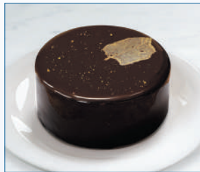
デザート「木葉天目」

全面ガラス張りのホワイトを基調としたシンプルなイメージのカフェです。大阪市中央公会堂や堂島川を見渡せる明るさと心地よい開放感あふれる空間は、美術鑑賞のあとのほっと一息にピッタリ。館蔵品をモチーフにした“映える”メニューも鋭意開発中です。