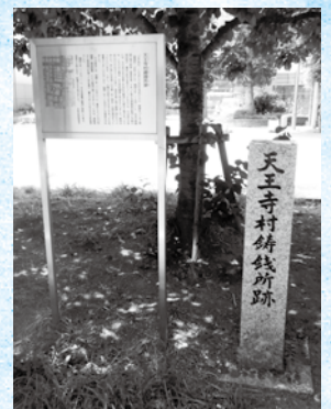
天王寺村鑄銭所跡の碑(中央区日本橋2)