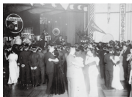
ダンス・パレスで開催されたコロムビア芸術家大会(昭和12年12月16日)

阪神国道沿いにあった尼崎の4つのホールだが、昭和2(1927)年に尼崎ダンスホールが、昭和3(1928)年、後に「タイガー」となる阪神社交倶楽部、昭和5(1930)年にキング・ダンスホールと阪神会館ダンス・パレスが開業する。キング・ダンスホールの経営者が大阪で取り締まる側であった元警察署長のふたりであったのもおもしろい。