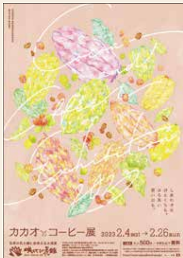
カカオ＆コーヒー展 2022.2.4(水)→2.26(土) 咲くやこの花館