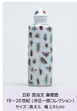
五彩 昆虫文 鼻煙壺 19~20世紀(沖正一郎コレクション) サイズ:高8.5、幅2.9(cm)

住所 〒530-0005 大阪市北区中之島1-1-26 TEL 06-6223-0055 FAX 06-6223-0057 ホームページ https://www.moco.or.jp アクセス ●京阪中之島線「なにわ橋駅」1号出口すぐ ●Osaka Metro・京阪本線「淀屋橋駅」1号出口、「北浜駅」26号出口各駅から約400m