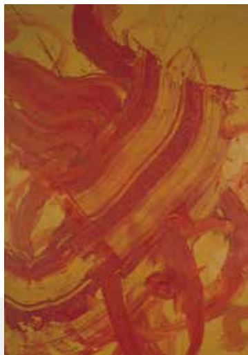
白髪一雄《赤牌》 1970年 大阪中之島美術館蔵 (万国博美術展出品作)

かでモダンな暮らしを先導しました。また、今や私たちの住まいのスタンダードとなった工業化住宅は、戦後に登場したまったく新しい商品であり産業でした。大阪は、私たち一人一人の小さくも大切な暮らしを支え、そのスタイルや価値をかたちづけてきたのです。住宅の外観や構造はもとより、当時の内装や設備、家電製品も忠実に再現された「みんなのおうち」は、実際に中に入ることができます。公募で決まったお名前の表札も掛かっています。ぜひ、高度成長期の暮らしを体感してみてください。