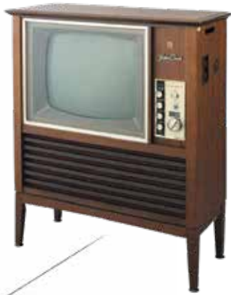
松下電器産業株式会社 《ナショナルテレビ 嵯峨 (TC-96G)》 1965年 パナソニックミュージアム蔵

本展示会の大きな見どころの一つは、積水ハウス株式会社の全面的な協力と多数のメーカー各社の熱意により、会場の5階展示室の中に建てられた、1970年代の実物大工業化住宅「みんなのおうち」です。戦後、大阪は家庭向け電化製品を国内外に広く供給する「家電王国」となり、豊