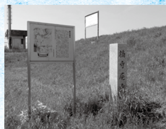
橋寺廃寺の顕彰碑(旭区太子橋3丁目)

現在は団地などが立ち並ぶ住宅地となっていますが、淀川の堤防には「橋寺廃寺」の顕彰碑が建てられています。そして守口市側には高瀬神社や、かつての京街道の風情を残すところなどもありますので、あわせて歩いてみてはいかがでしょうか。 (大阪市教育委員会事務局 文化財保護課)