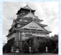
竣工から90周年を迎える大阪城天守閣