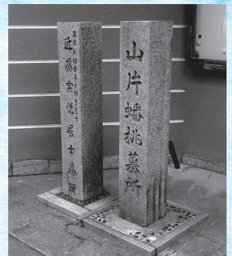
善導寺前の顕彰碑(北区与力町2-5)

大坂町人の文化力の象徴の一人ともいえる蟠桃ですが、没後200年を迎えます。北区与力町の善導寺には墓所があって門前には顕彰碑が建てられています。(大阪市教育委員会事務局 文化財保護課)