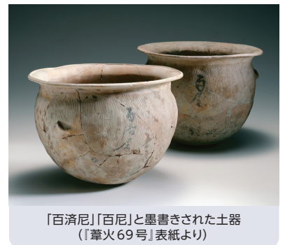
「百済尼」「百尼」と墨書きされた土器

アクセス ●Osaka Metro「谷町四丁目」2号・9号出口 ●大阪シティバス「馬場町」バス停前