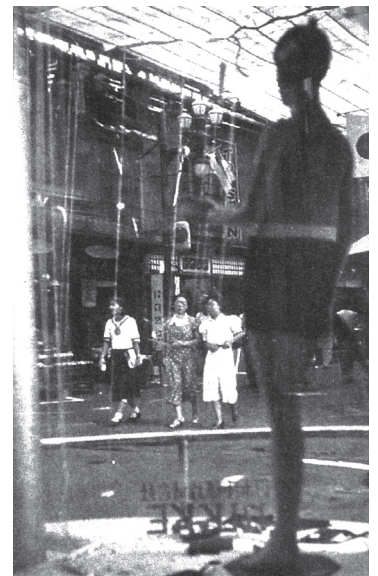
「ニッケ」から見た心齋橋筋と雨よけ日よけ(橋爪節也「モダン心齋橋コレクション」より)

街の賑わい復活を祈念しつつ、むかしむかしの心齋橋筋の夏にタイムトラベルしてみました。