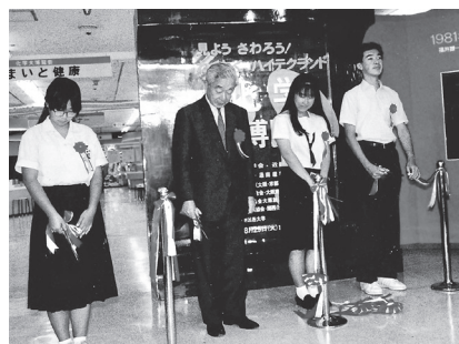
1989年、近畿化学協会70周年記念事業の「化学大博覧会—わくわくハイテクランド」のテープカット。中央はノーベル賞受賞の福井謙一博士。