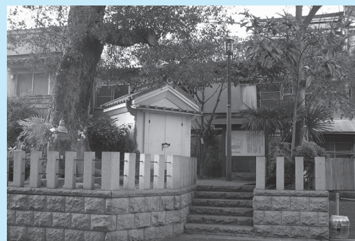
天下茶屋跡(西成区岸里東2、阪堺「天神ノ森」北西)