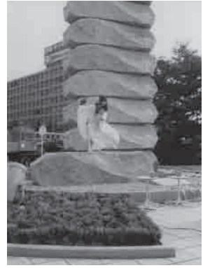
除幕後、古代衣装の女性が祝舞を舞い、モニュメントに精気が満ちる。

ある。大阪の各所に残され、城内には、「残念石」を集めた刻印石広場があるし、天守前の「残念石」は、昭和56(1981)年、石の切り出し先で、大坂城残石記念公園もある小豆島の青年会議所創立10周年記念事業として、大阪青年会議所とともに運んだものである。《タイムストーンズ400》の原型は、このイベントで小豆島の黒田長政の石切丁場から「修羅」(当時の木製運搬ソリ)で運ばれた。