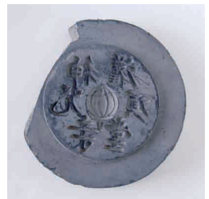
「神呪寺灌頂堂」瓦范(径18.5cm) 大阪文化財研究所保管

大阪文化財研究所 ●ホームページ http://www.occpa.or.jp/