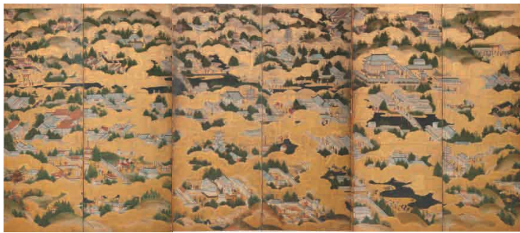
平城平安洛中洛外図屏風