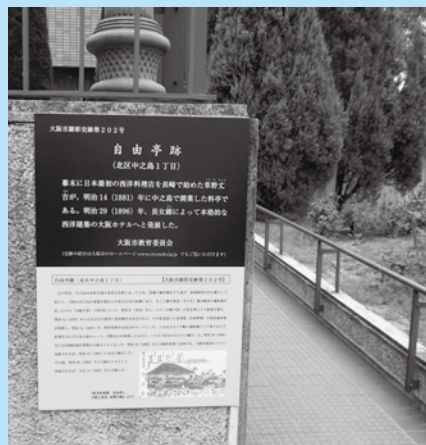
東洋陶磁美術館の東側園路脇にある顕彰パネル