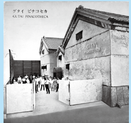
「グタイピナコテカ」のパンフレット(1962年)の表紙