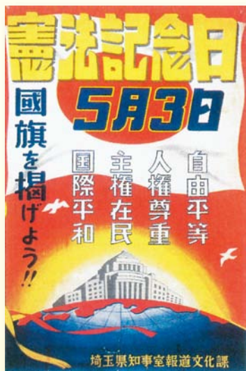
憲法記念日ポスター