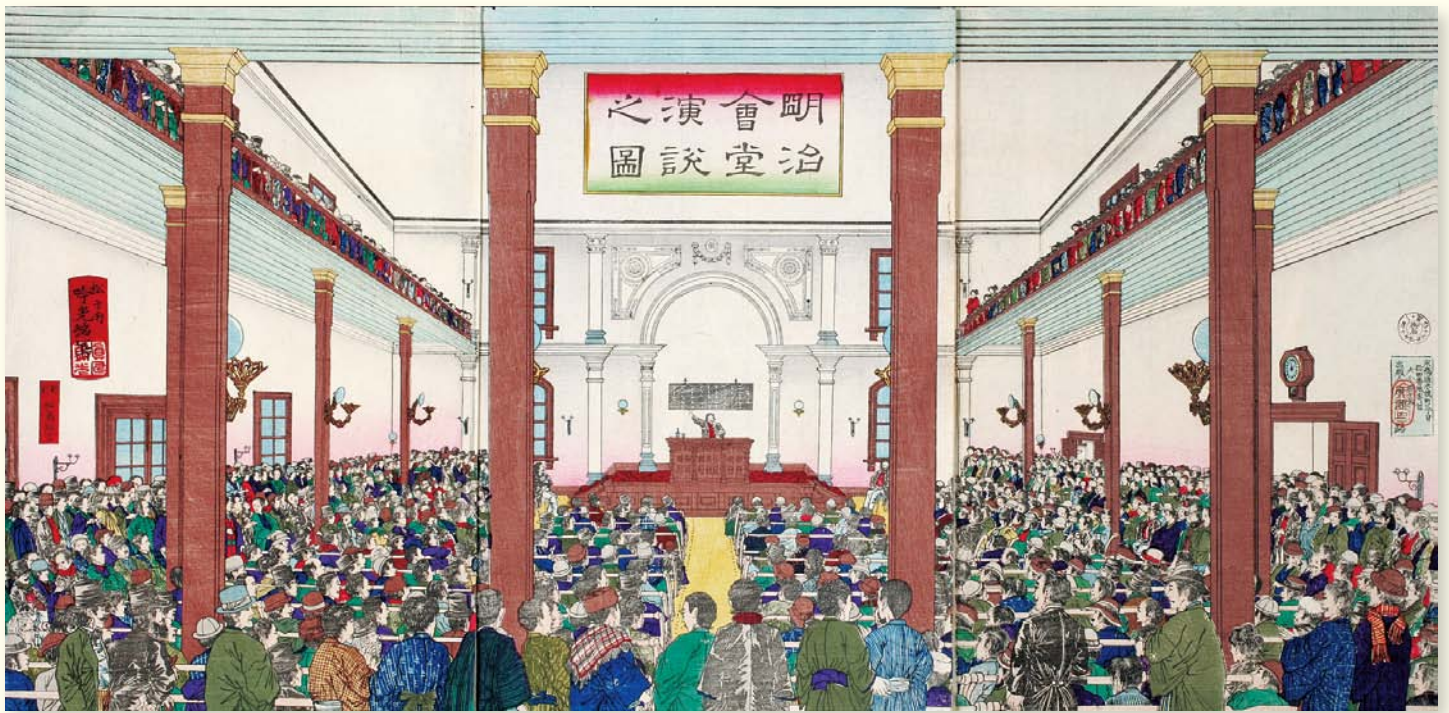
明治會堂演說之圖