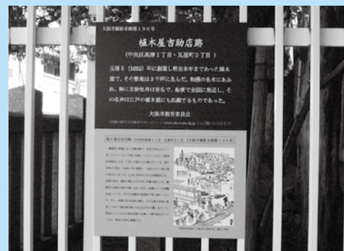
高津宮の相合坂登り口にある顕彰パネル