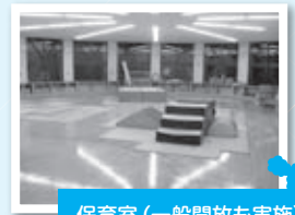
保育室 (一般開放も実施)