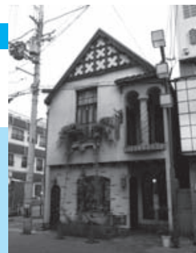
登録文化財となっている ギャラリー再会

新世界にお越しの際は、こうした文化財にも目を留めてみてください。(大阪市教育委員会 文化財保護担当)