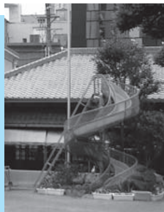
愛珠幼稚園 廻旋滑り台 (手すりは後につけたものです)

そのほかにも愛珠幼稚園にはたくさんの遊具、教材などがあります。そのつもりで見学すると新しい発見もあるとおもいます。4月21日(土)午後1時から4時まで一般公開をおこないます(詳しくは23頁の「募集・お知らせ」コーナーをご覧ください)。春の日の1日、愛珠幼稚園におこしください。