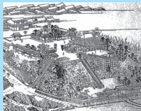
「摂津名所図会」にみる新清水寺(本堂の正面が展望台)

風通しも良かったため、夕涼みをかねて大阪湾に沈む夕日と大阪の町並みの眺望を楽しんだのでしょう。