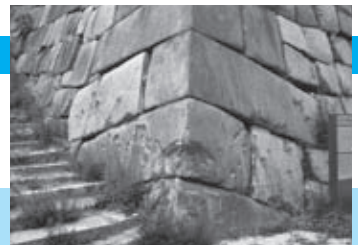
石垣に残された機銃掃射の痕

大阪には昭和20年3月13日の大空襲を最初として、同年8月14日まで計8回の大空襲がありました。大阪城も大きな被害を受け、貴重な文化財も多く焼失しました。数ヶ所の石垣に、その時の痕跡をみることができます。天守閣の東北側の石垣には、近くで爆発した1トン爆弾の影響により、石垣がずれてでこぼこになっているところがあります(⑤)。また天守閣の北側、山里曲輪(やまさとくまわ)には、終戦直前には女子防空通信隊の宿舎がありました。現在は刻印石広場となっていますが、ここにおいてゆく石段の北側の石垣に、6月1日の空襲の時の機銃掃射によってえぐられた生々しい痕跡が残されています(⑥)。このほかにも大阪城のあちこちに戦争の爪あとをみることができます。