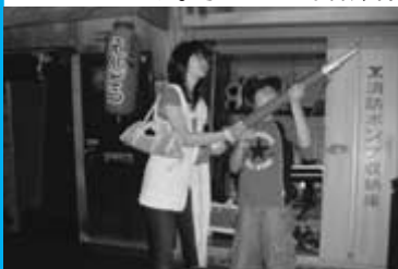
実物の重いポンプを使う「消火コーナー」

よう。地震で崩れた町並みで消火作業、地震体験、煙の中の避難など、リアルな設備に、最初、持っていた遊び感覚は薄れ、最後には真剣そのものになっていきます。