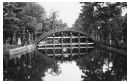
かつて住吉大社の西側にあった低湿地の跡を留める池