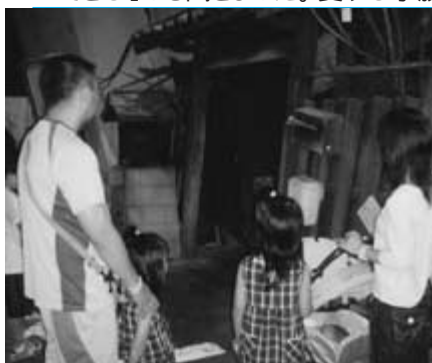
堺市から来たご家族の真剣な目!

「応急救護コーナー」で、「大切な家族のためにがんばりましょう」といわれました。センター長からは「自然災害をくい止めることはできないけれど、最小の被害にとどめることはできる」とも聞きました。愛する家族のため、大切にしたい