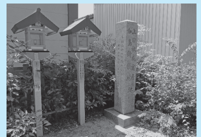
香具波志神社にある顕彰碑