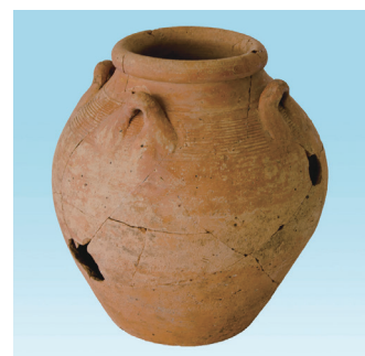
タイ(メナム・ノイ窯)産陶器壺

大阪文化財研究所 ●所在地 〒540-0006 大阪市中央区法円坂1-6-41 ●TEL 06-6943-6833 ●FAX 06-6920-2272 ●アクセス 大阪歴史博物館 地下鉄「谷町4丁目」2または4号出入口 シティバス「馬場町」すぐ ●ホームページ 大阪文化財研究所 http://www.occpa.or.jp/ 大阪歴史博物館 http://www.mus-his.city.osaka.jp/index.html