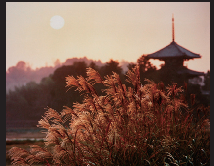
入江泰吉《大和路 秋深む法起寺》1986年 大阪府蔵