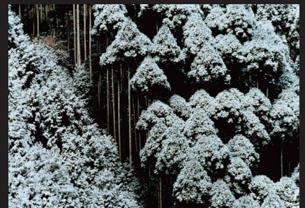
岩宮武二《北山杉雪景(「京都」より)》 カラープリント 大阪府蔵