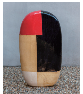
金子潤《無題》2014年 h: 63.5cm 大阪市立東洋陶磁美術館蔵 藤田裕一氏寄贈

※今回紹介した作品は、大阪市立東洋陶磁美術館で開催中の国際巡回企画展「イセコレクション—世界を魅了した中国陶磁」展の併催「受贈記念 金子潤」に出品されています。<12/3(日)まで>