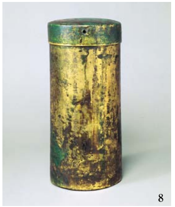
①重要文化財 役行者倚坐像 奈良・櫻本坊 ②那智参詣受茶羅図 和歌山・熊野速玉大社 ③重要文化財 蔵王権現立像 奈良・如意輪寺 5月8日~5月18日展示 ④女神坐像 和歌山・三谷薬師堂 ⑤国宝 熊野速玉大神坐像 和歌山・熊野速玉大社 ⑥重要文化財 如来・菩薩坐像 奈良・大峯山寺 ⑦重要文化財 熊野本地仏受茶羅図 京都・聖護院(前期展示) ⑧国宝 経筒 奈良・金峯神社