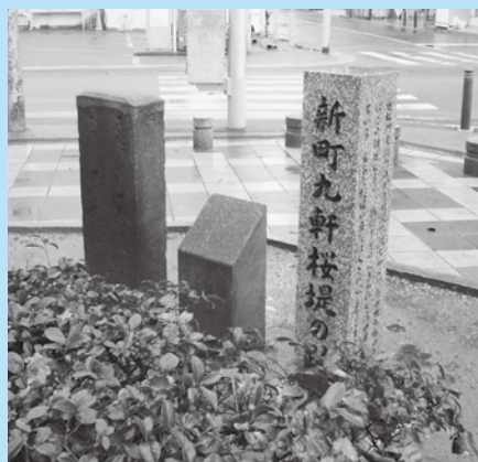
千代女の句碑と「新町九軒桜堤の跡」碑