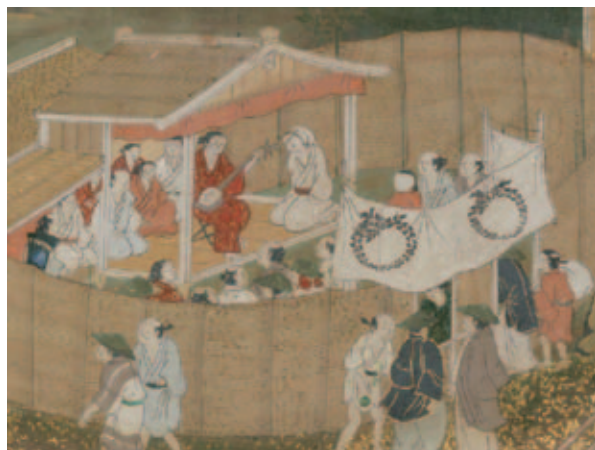
五条河原の芝居小屋（洛中洛外図屏風・部分）

※今回紹介した作品は、特集展示「たっぷり見たい屏風絵」(9月11日(火)~10月14日(日))に出品されています。