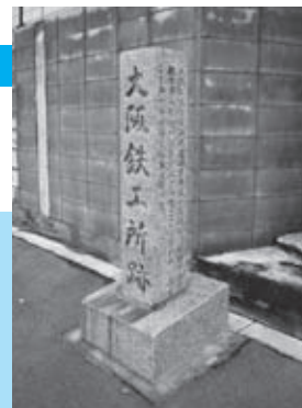
春日出橋南詰にある大阪鉄工所跡の碑

日本人の妻をむかえたハンターは、心から日本を愛し、日本人を信頼する経営を行ったといえます。そのハンターの住宅(重要文化財)が神戸市立動物園内に移築保存されています。ハンターの業績を偲んで訪ねてみてください。(大阪市教育委員会 文化財保護担当)