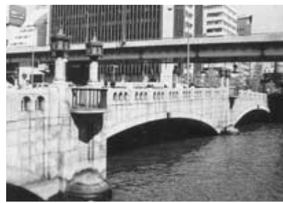
上:淀屋橋、下:大江橋